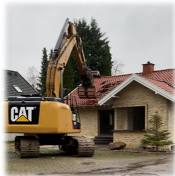
Gamle villa under nedrivning